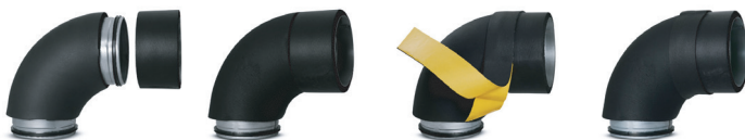
postup při instalaci pásky