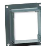
KBD příruba výtlak