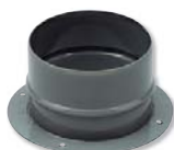
KBA příruba sání